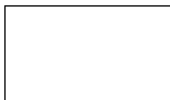
Рис. 1. Название рисунка

Текст статьи. Текст статьи [1]. Текст статьи. Текст статьи [2; 3]. Текст статьи. Текст статьи (рис. 1).